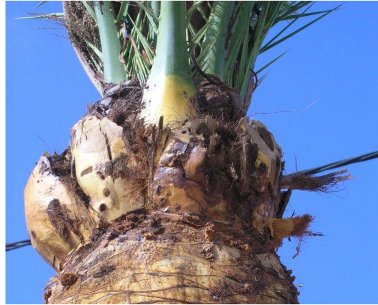
Fig. 8. Galerías en la base de la corona, ocasionadas por R. ferrugineus .