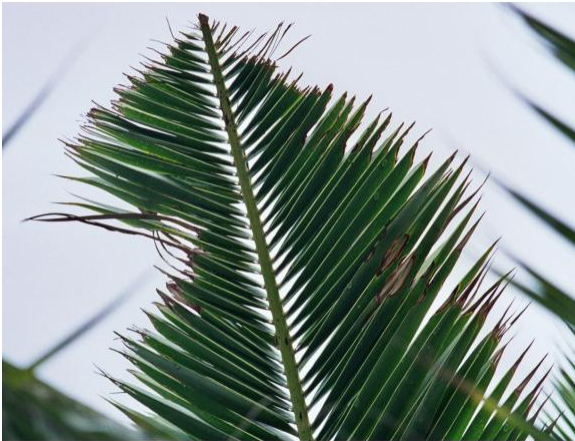
Fig. 7. Daño por alimentación en hoja.