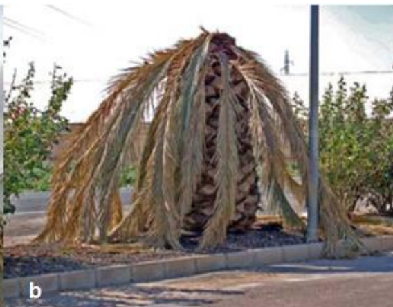
Fig. 11. a) Palmas con daños avanzados por R. ferrugineus . b) Palma canaria muerta por ataque de R. ferrugineus .