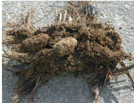
Fig. 10. Pupas a nivel de raíces (palma).