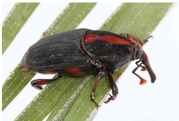
Fig. 6. Adulto de R. ferrugineus , ejemplar encontrado en California, EUA.