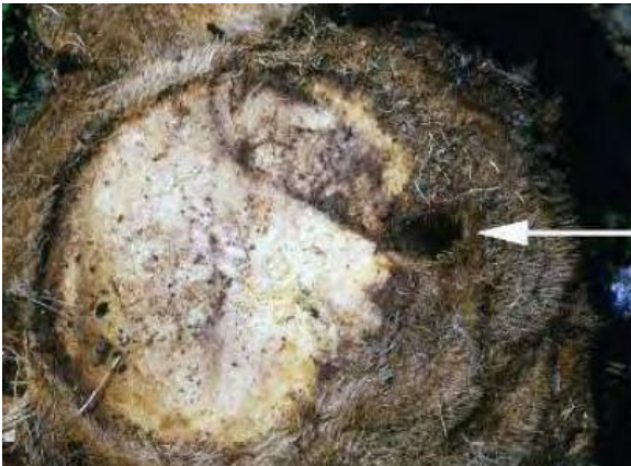
Fig. 9. Galerías en troncos bajando a raíces (palma).