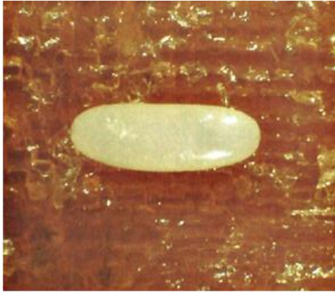
Fig. 1. Huevo de R. ferrugineus .