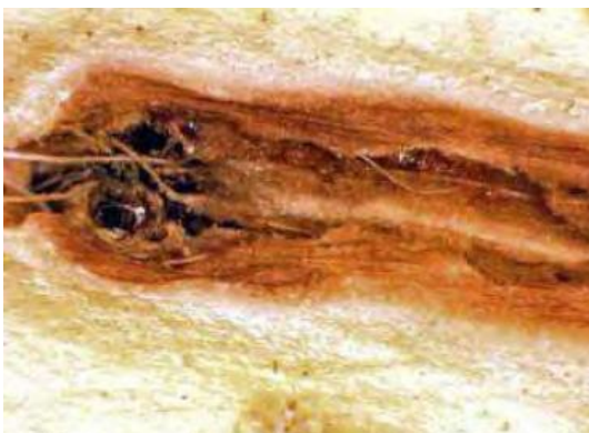
Fig. 5. Daños en palmera (interior) por alimentación de R. ferrugineus .