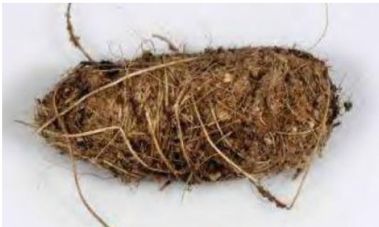
Fig. 3. Pupa (capullo) de R. ferrugineus .